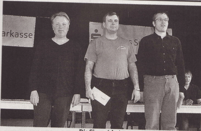
Die Sieger (vlnr):