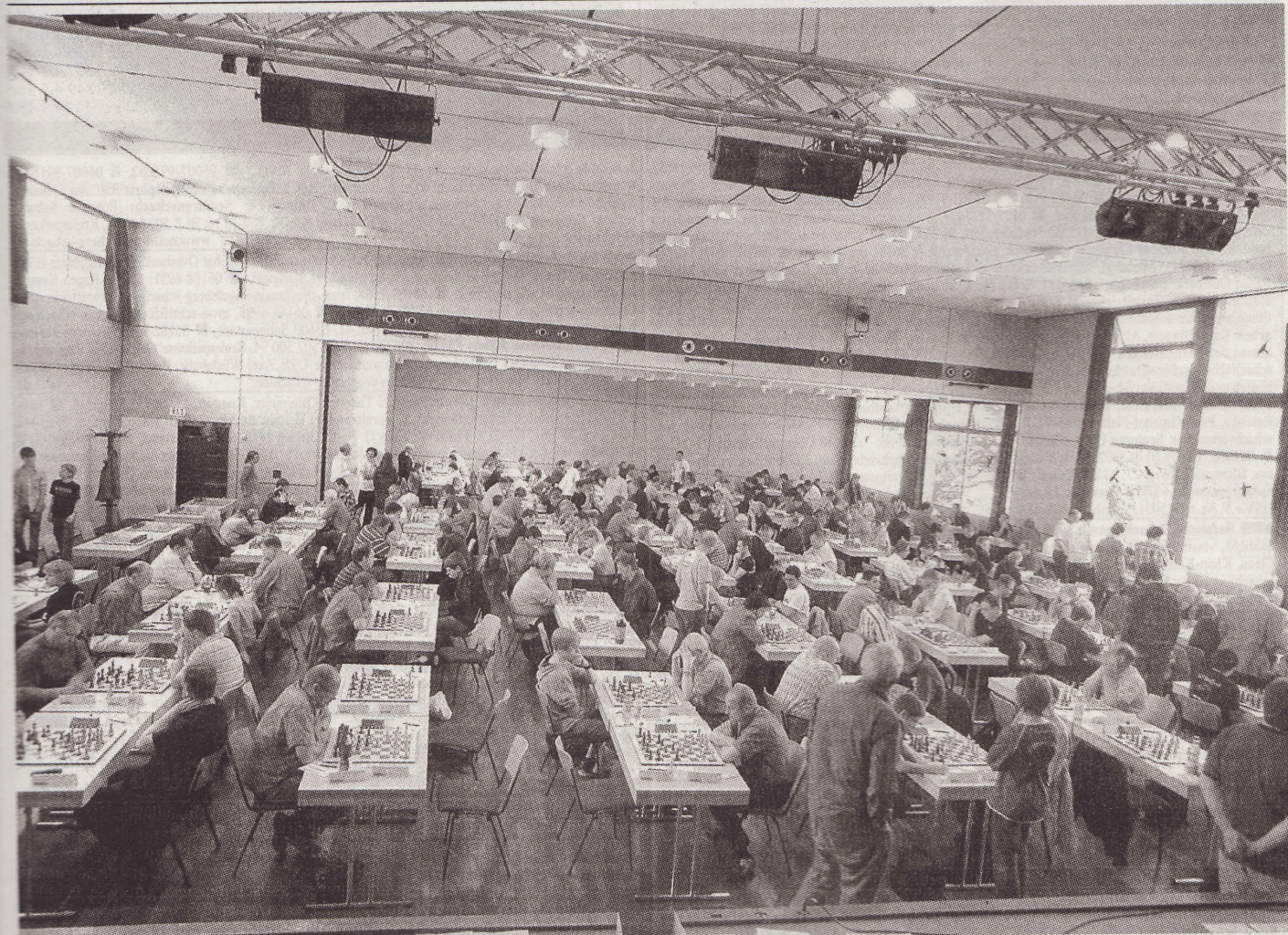
Blick in den Spielsaal: Holzbretter und großzügige Platzverhältnisse